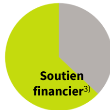
Installation de 200 kW env. 63%

3) Estimations pour chauffages au bois (granulés).