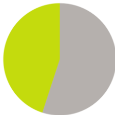
Installation de 100 kW env. 45%