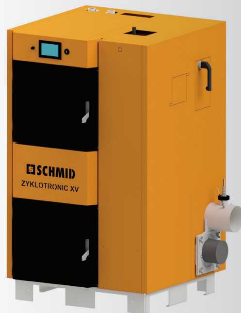
ZYKLOTRONIC XV 30/30